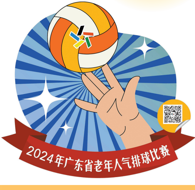
员 粤体彩 插图/采采

年人气排球爱好者提供了一个展示技艺、交流经验的宝贵平台,也彰显了“公益体彩 乐善人生”的深刻内涵,这是中国体育彩票积极履行社会责任、助力全民健身事业发展的又一力证。接下来,河源体彩将继续秉承“公益体彩 乐善人生”的品牌理念,致力于支持各类体育赛事与群众体育活动,为提升全民健康水平、丰富群众体育文化生活贡献力量。