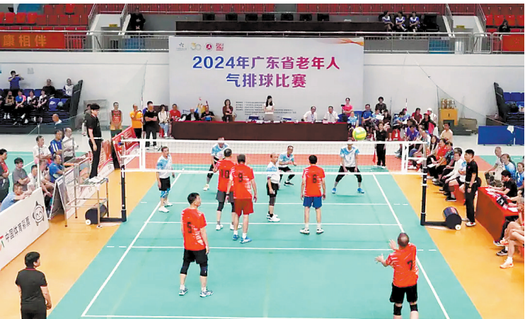
老年人气排球比赛现场

当天,随着裁判员一声哨响,比赛正式开始。赛场上,老将动作矫健,他们凭借着多年积累的精湛球技与彼此间的默契配合,发球时凌厉有力、巧妙旋转;接球稳如泰山,轻托慢送间尽显功底;扣球似猛虎下山,气势磅礴;拦网如铜墙铁壁,坚不可摧。每一个动作都饱含着对气排球的热爱与对胜利的渴望,每一次击球都伴随