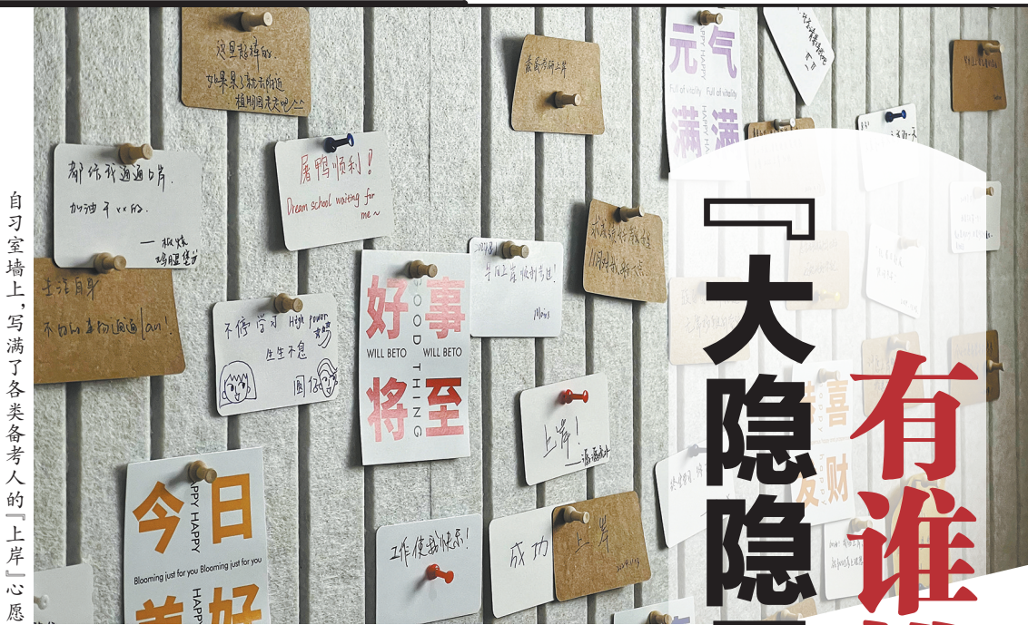
自习室墙上，写满了各类备考人的「上岸」心愿

而在行政执法类申论试卷中，应用文占比增加，考查了两道应用文写作题，分别是第三题，“草拟工作指南中的工作事项及其相应工作内容”，以及第四题，“拟写一份谈话内容提纲”。而去年的行政执法类仅考查了一道应用文写作题，即第三题，“写一份情况报告”。