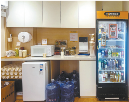
不少自习室设有简单的零食、饮水区