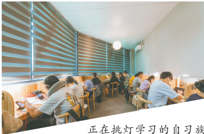
正在挑灯学习的自习族

爱沙尼亚共和国四面环水，爱沙尼亚在波罗的语中意为“水边的居住者”，是一个名副其实的沿海国家。这是个小巧精致的国家：占地面积约4.5万平方公里，130多万人口；森林覆盖率高达48%，是世界空气质量最好的国家之一；在教育医疗、养老等方面投入大，电信IT行业处世界前列，被列入发达国家。由于地理位置等因素，爱沙尼亚的华人并不多。