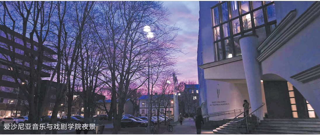
爱沙尼亚音乐与戏剧学院夜景