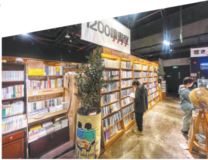
有书店开设了付费读书室