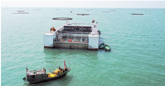
湛江 “海威1号”海洋牧场

广东湛江，是个冬天仍然能够户外赶海的宝藏城市。在湛江坡头区，这个“生蚝之乡”每年12月至次年清明是官渡生蚝的丰收季；作为“中国金鲳鱼之都”，秋冬时节的湛江现代化海洋牧场上，深水网箱中的肥美金鲳鱼也迎来了丰收的时刻。 从舌尖出发，感受海洋的馈赠和科技的魅力。近年来，湛江以深入实施“百县千镇万村高质量发展工程”为契机，加快建设现代化海洋牧场示范市，形成从种业、养殖、装备到精深加工的全产业链条，助力渔业增效、渔民增收。