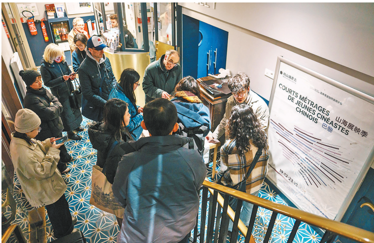
放映前,众多观众在电影放映厅外等候入场