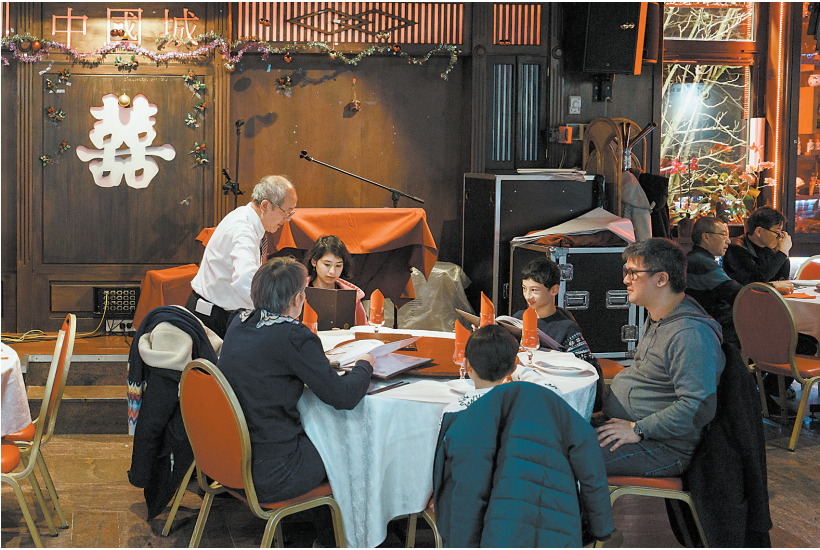
巴黎的一家中餐厅,服务员正为顾客点菜