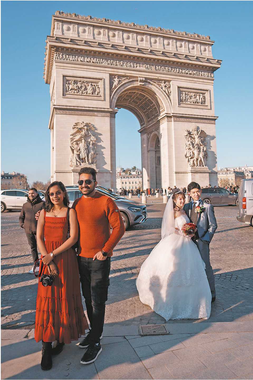
游客在凯旋门旁合影留念