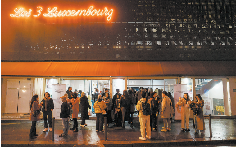
放映结束,许多观众仍然在电影院外交流观影心得