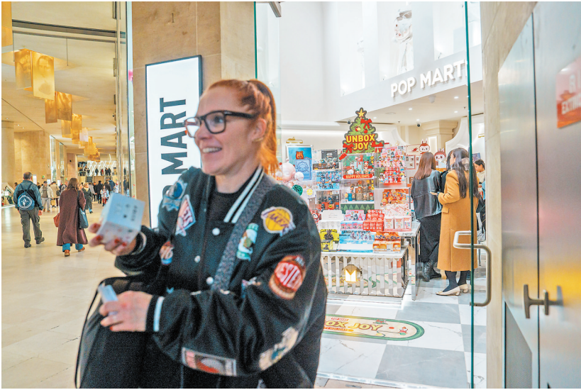
来自中国的泡泡玛特商店在当地颇受欢迎