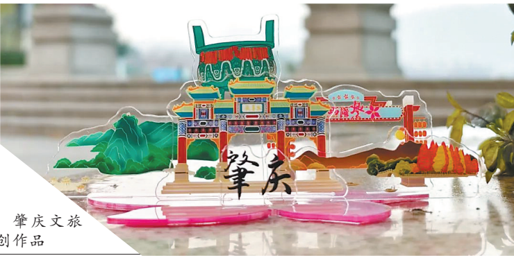
肇庆文旅 文创作品

2024年4月，广东省景区行业协会也联合广州市景协旅游发展中心、广州购书中心有限公司等单位共同推出“广东礼物共创共享计划”项目，推出“广东礼物”统一的品牌形象、展陈设计方案，开展“广东礼物”代表性旅游商品征集、“广东礼物”景区文创设计大赛、“广东礼物”合作地景区征集、“广东礼物”品牌机构征集等系列活动，推动“广东礼物”文创进驻地标景区。