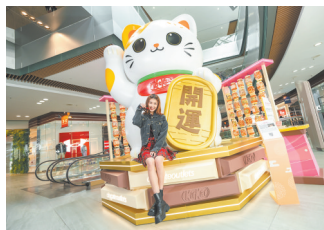
“幸运捕手”春节主题活动现场

游客可与“招财猫”和“招福达摩”合照互动，玩“喵来运转”AI互动占卜游戏，兑换限量版幸运护身符和全新口味的巧克力，以及参与一系列新年贺岁活动，如日式传统舞蹈表演、舞狮开年典礼和舞狮贺岁巡游等。