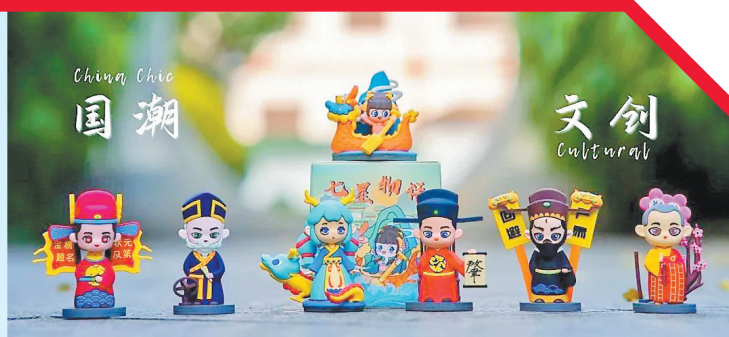
肇庆文旅文创作品