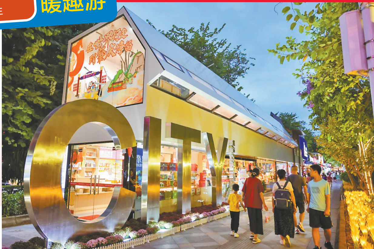
肇庆文旅文创体验中心