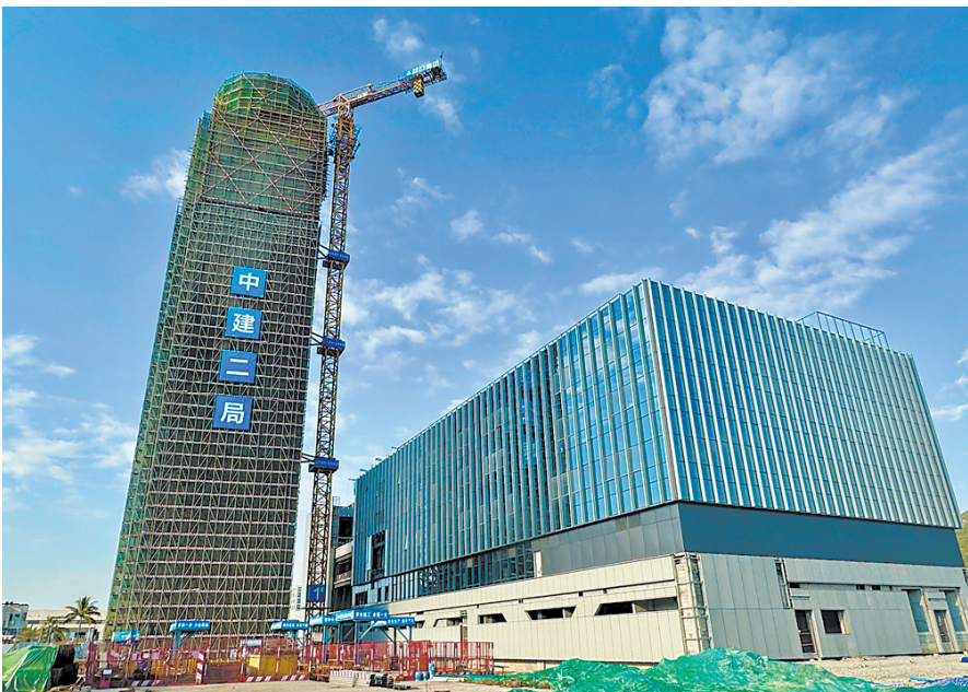
珠海机场塔台项目实景图

羊城晚报讯 日前,由中建二局承建的珠海机场塔台项目全面封顶,标志着项目全面进入幕墙、装饰装修施工阶段。