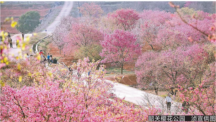
韶关樱花公园

赏花祈福泡温泉,请到韶关过大年!韶关诚意满满,准备了200多项跨年文旅体活动,60多项优惠措施,迎接一年中最热闹的时刻。