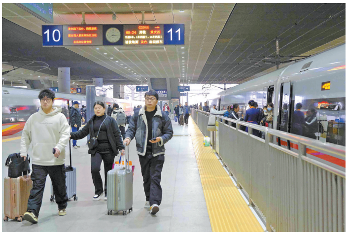
旅客踏上归家之路

实施节后用工“日调度 周报告”。充分发挥人力资源服务专员作用,落实“日调度 周报告”机制,每天通过电话、实地走访等形式掌握企业节后开工、员工返岗(含留莞)、新招员工人数等情况,对800家重点企业、3000多家监测企业等重点企业落实摸底调查、分级分类跟踪服务,帮助企业尽快满工达产。