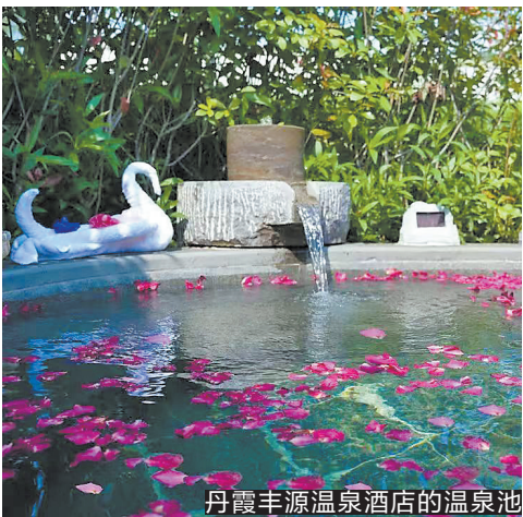
丹霞丰源温泉酒店的温泉池