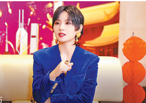
歌手周笔畅： 祝大家身体健康，万事如意！