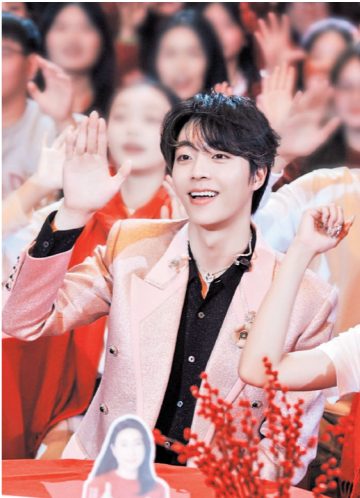
祝大家2025年天天开心，身体健康，新年快乐！ 歌手陈立农：