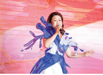
女高音歌唱家陶英

金蛇舞动的喜庆时刻，众多文体明星为羊城晚报读者送上充满年味的祝福，献上最诚挚的新年问候。让我们一起分享这份祝福，迎接一个充满希望和喜悦的蛇年新春！