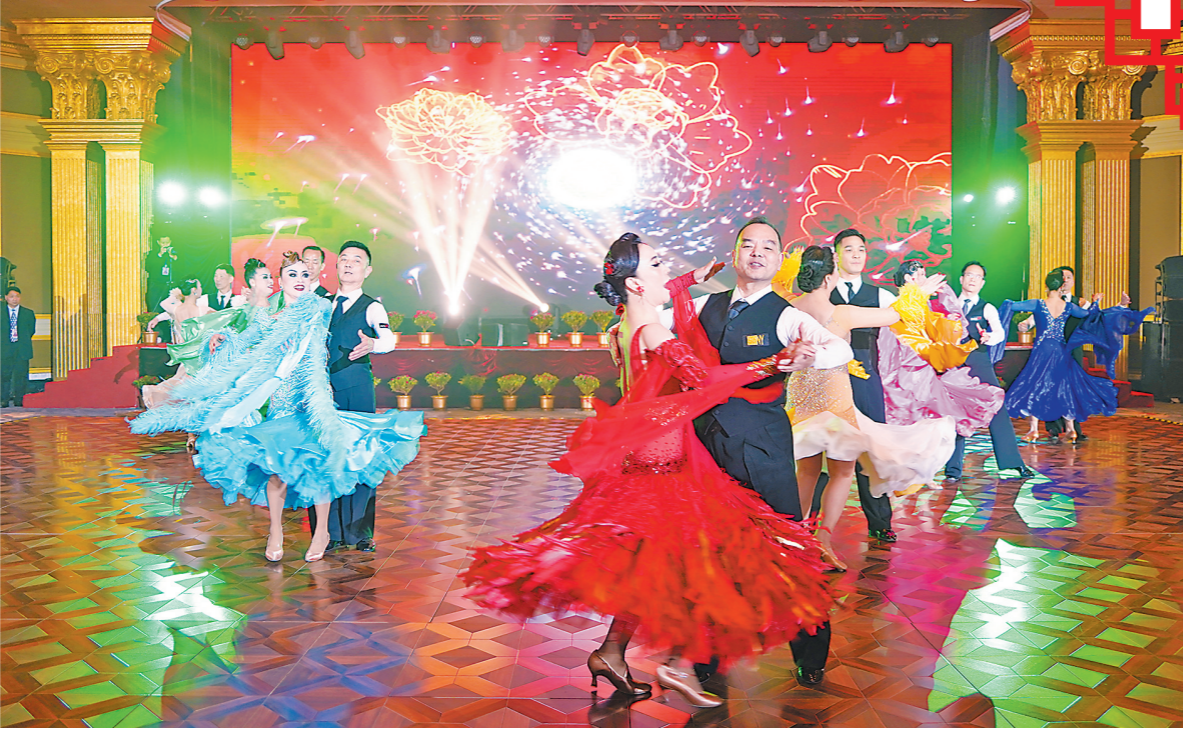
七彩裙摆在舞池中绽放