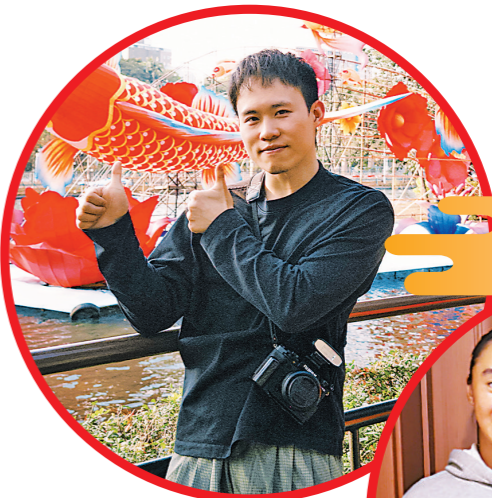
2024年巴黎奥运会男子3米跳板冠军谢思埸： 祝羊城晚报的读者朋友们 们身体健康，蛇年大吉！

金蛇舞动的喜庆时刻，众多文体明星为羊城晚报读者送上充满年味的祝福，献上最诚挚的新年问候。让我们一起分享这份祝福，迎接一个充满希望和喜悦的蛇年新春！