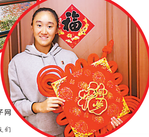
2023年广州国际女子网球公开赛女单冠军王曦雨： 祝羊城晚报的读者朋友们 蛇年大吉，蛇来运转！