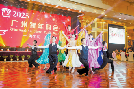
广州新年舞会吸引众多舞蹈爱好者