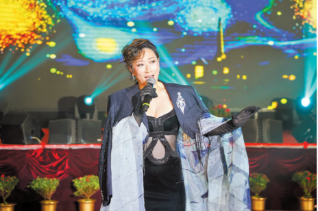
女高音歌唱家周小雨