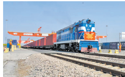
1月29日，粤港澳大湾区蛇年新春首趟中欧班列发出

在产业高质量发展的背后，是工业投资的热潮涌动。改造提升传统产业，培育壮大新兴产业，前瞻布局未来产业，通过产业结构的不断优化升级和产业科技的互促双强，工业大省广东的新动能已然澎湃激荡。