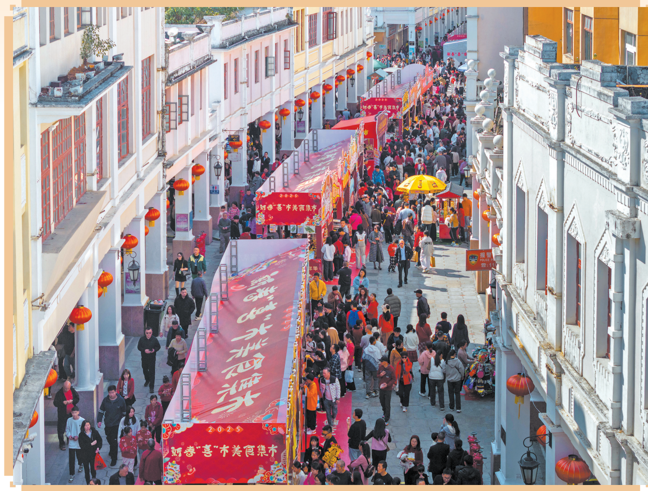
深中通道开通后首个春节，中山满城烟火气。图为在孙文西路步行街举行的新春嘉年华