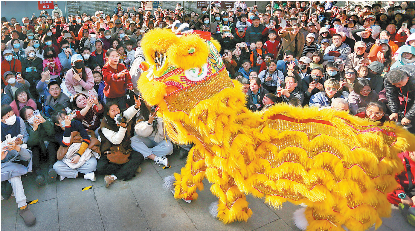
1月29日，广东省佛山市祖庙黄飞鸿纪念馆的醒狮巡游表演

今年春节假期，焕新升级的孙文西路步行街成为游客打卡的主要目的地之一。1月29日（大年初一），2025年中山春节嘉年华在此拉开帷幄。连日来，以“金蛇舞香山 岐来贺新春”为主题的嘉年华融合中山美食文化、非物质文化遗产和中华优秀传统文化元素，以美食品鉴、文艺展演、互动体验等形式，为市民奉上最具中山味、湾区范的精彩新年。 从石岐街道中兴中广场步入孙文西路步行街，首先映入眼帘的是嘉年华绚丽的电子门楼。前行数步，连串的花灯悬挂在上空，将街道装点得分外喜庆。 穿过“喜迎新春”花灯，以红色为主色调的新春“喜”市美食文化集市汇聚了来自盈喜婚宴酒楼、三溪酒楼、岐苑酒家、永怡泓悦酒楼等中山知名酒楼的特色美食，从石岐红烧乳鸽、酥炸脆肉鲩，到崖口煲仔饭、神湾菠萝牛肋条，再到碗仔翅、菊花芝士饼、茶薇蛋卷、小榄炸鱼球……各色美食小吃应有尽有，吸引了众多市民游客驻足品尝。 在香山古风文化体验馆内，火红的灯笼、应景的装饰随处可见，广府金绣、手工沉香、漆扇制作、手工刺绣等精美文创产品不仅彰显传统文化的独特魅力，也吸引众多市民游客欣赏购买。 除美食和文创产品外，嘉年华还包含一系列别出心裁的活动，融合古典与