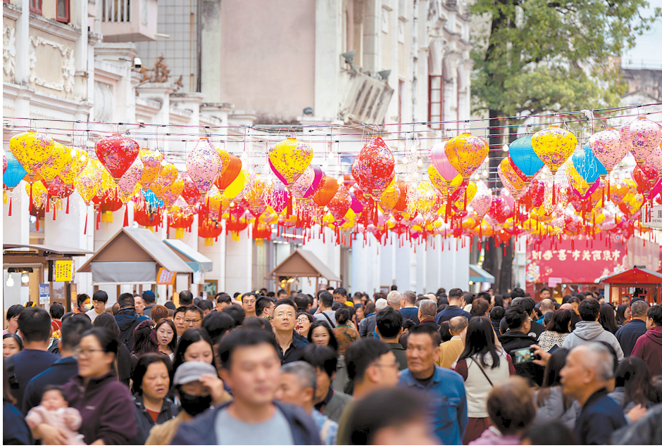
孙文西路步行街内开启的新春嘉年华

1月31日（大年初三），由中山曲艺家协会带来的经典粤剧表演在中山影视城罗马剧场上演。作为春节期间的重点文化演出，一连三天的粤剧演出在这里持续上演，当天正是这场文化盛宴的最后一场。戏迷们早早来到剧场，场内座无虚席。 此次表演包含6个经典粤剧剧目，包括《驱宫贺寿舞霓裳》《十八相送》《梦会太湖》等。演出在经典剧目《化蝶》中拉开帷幕，演员凭借精湛的唱腔、细腻的表演，一招一式，一颦一笑，将剧中人物的情感和故事演绎得淋漓尽致。 据了解，春节假期期间，中山影视城2025年新春活动一连多天好戏连台，日与夜的精彩交织上演。其中，经典粤剧展演、非遗彩带龙、醒狮贺岁巡游、穿越快闪舞蹈、综艺演出和街区舞蹈表演等，从年初一持续至年初六，与市民一同闹新春；中山影视城夜场“梦幻之夜”彩灯会场场景丰富，龙凤呈祥、紫光森林、萤火虫秘境、花仙子等大型彩灯展增添节日氛围，迎客舞、非遗火盆、打铁花和篝火晚会等演出独具民俗特色，陪伴市民度过