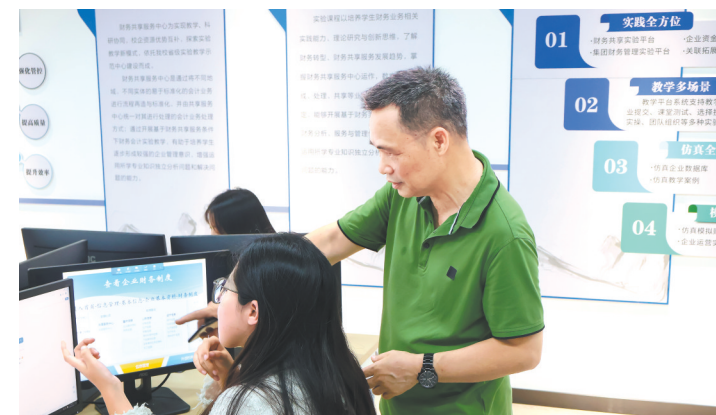
广州新华学院教师在指导学生

广州新华学院通过产教融合等系列探索，不仅提升了人才培养质量，也为地方产业发展提供了强有力的支撑。展望未来，刘荣海表示，学校将继续深化产教融合，加强与地方政府、企业的合作，推动教育、科技、人才一体化发展，为广东经济高质量发展贡献更多智慧和力量。