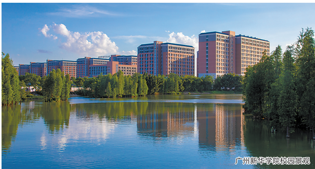
广州新华学院校园景观