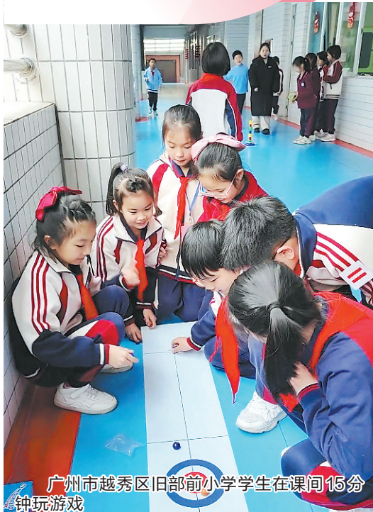
广州市越秀区旧部前小学学生在课间15分钟玩游戏

广州推行课间15分钟活动近半月后，越秀区部分小学的课间变样了：学生们自发组织起丰富多彩的课间游戏，跳皮筋、丢沙包、投壶等传统游戏重现校园，还有学生脑洞大开，自创了许多新奇有趣的游戏玩法，更有“游戏管理员”这一新角色“上线”。