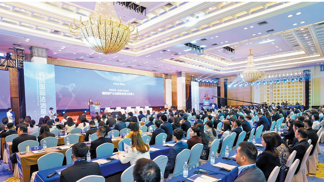
跨境破产法国际论坛现场

在主题四“重塑企业重组思路:庭外债务重组和预重整”中,嘉宾们共同探讨庭外债务重组和预重整的新思路,为企业提供更灵活、高效的重组方案,助力企业重生。嘉宾们通过分享庭外债务重组和预重整的成功案例,探讨新的重组模式和方法,为困境企业提供更多选择和机会。