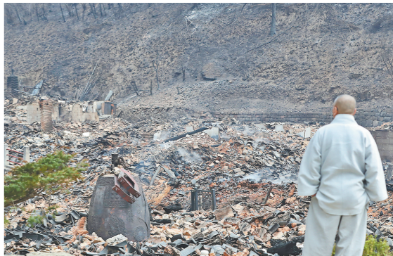
3月27日，在韩国庆尚北道义城郡，僧人站在大火过后的古寺废墟前。

新华社电 据韩国中央灾难安全对策本部27日21时通报，韩国多地森林火灾已造成28人死亡、32人受伤。