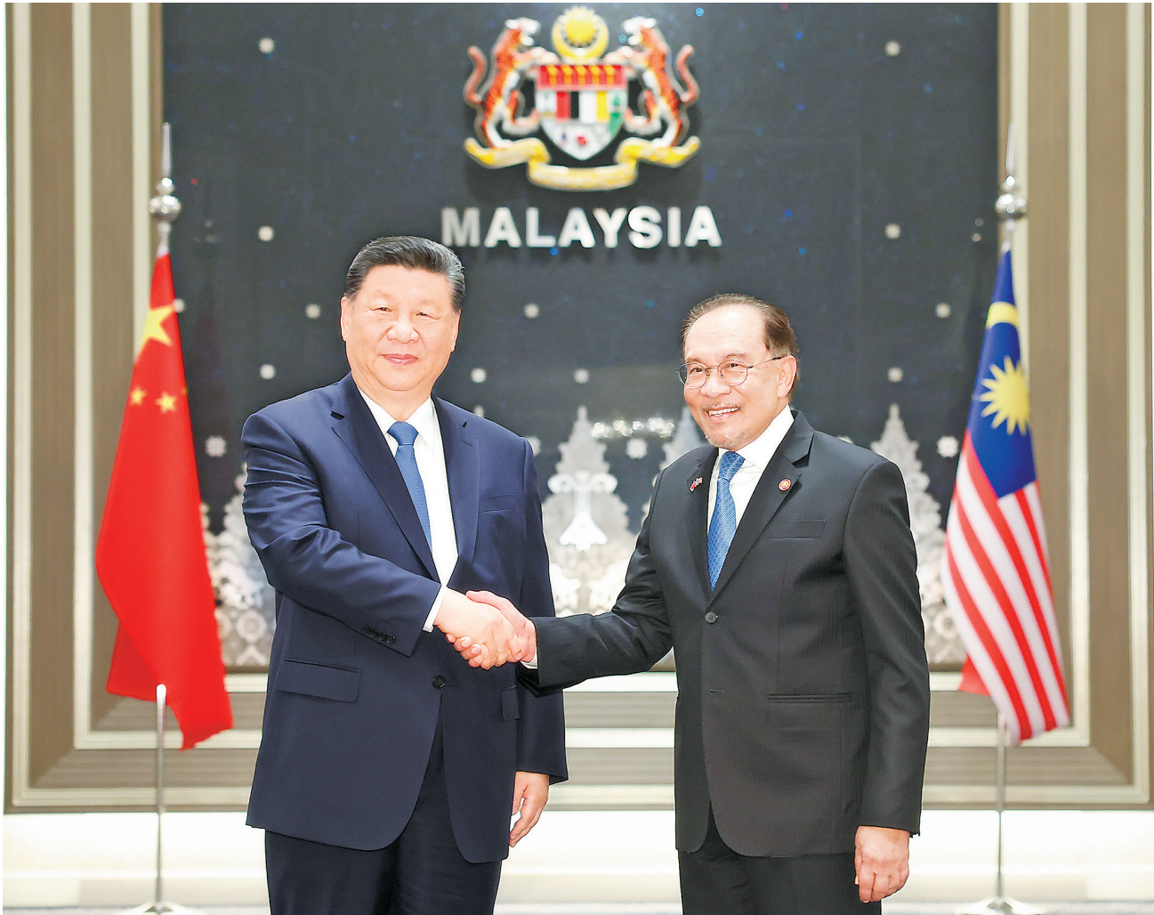
4月16日下午,国家主席习近平同马来西亚总理安瓦尔在布特拉加亚总理官邸举行会谈