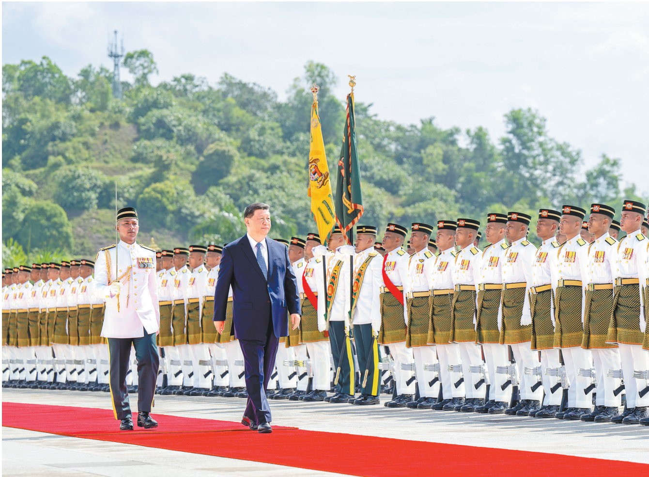
4月16日上午,马来西亚最高元首易卜拉欣在马来西亚国家王宫同中国国家主席习近平举行会见。易卜拉欣在国家王宫广场为习近平举行隆重欢迎仪式。这是习近平检阅仪仗队