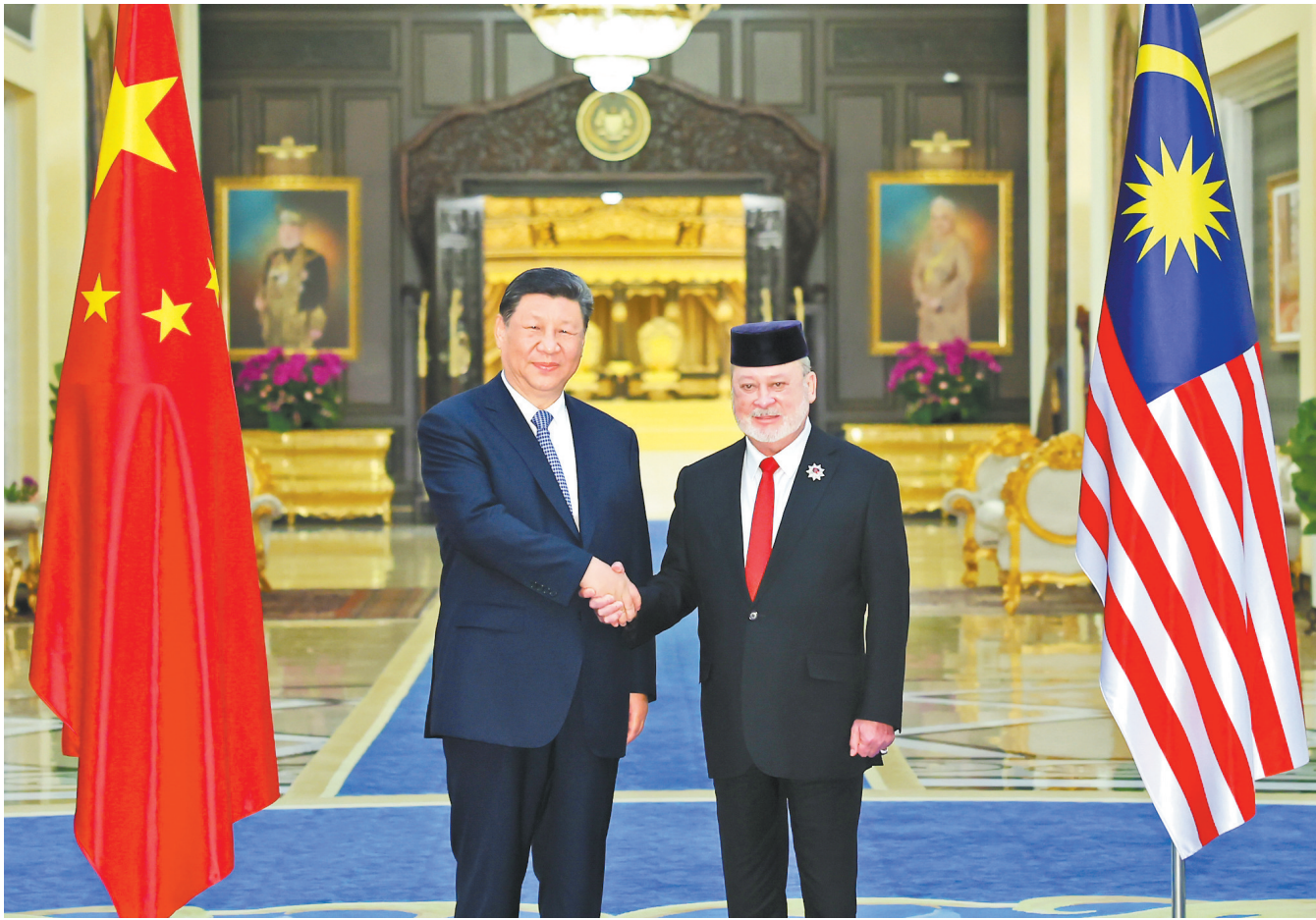
4月16日上午,马来西亚最高元首易卜拉欣在马来西亚国家王宫同中国国家主席习近平举行会见