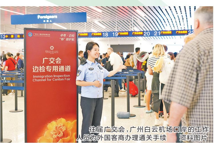
往届广交会，广州白云机场口岸的工作人员为外国客商办理通关手续 资料图片