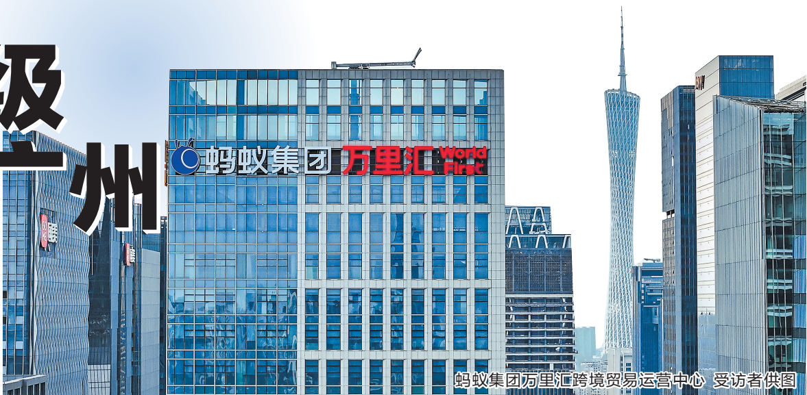
蚂蚁集团万里汇跨境贸易运营中心

继抖音落子广州琶洲引发大量关注后，又一家世界级独角兽落子广州。4月21日，蚂蚁华南数字运营中心、万里汇跨境贸易运营中心“双中心”正式启用。去年，广州市人民政府与蚂蚁科技集团股份有限公司签署战略合作协议，明确将在数字金融、跨境支付、科技创新等领域深化合作。与此同时，蚂蚁国际旗下万里汇(WorldFirst)也持续加码中国市场，在广州设立跨境贸易运营中心，与华南数字运营中心形成“双中心”战略布局，全力推