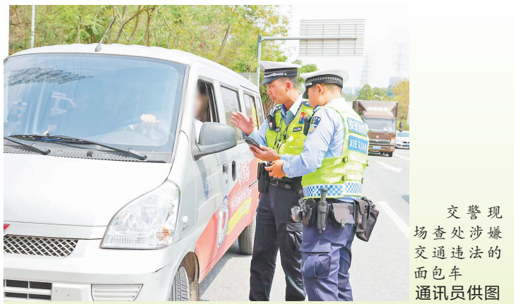
交警现场查处涉嫌交通违法的面包车

广东省公安厅交管局有关负责人表示，公安机关严格查处面包车违法载人等违法行为的同时，希望广大群众自觉抵制乘坐超员和非法营运车辆，不要图一时之便选择网络揽客、站外经营的“黑车”。