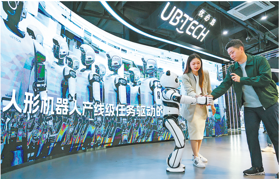
一季度广东“三新”行业用电量同比增长32.9%,新质生产力带动作用持续显现

4月25日,记者从南方电网广东电网公司获悉,今年第一季度,广东全省全社会用电量1870.66亿千瓦时,同比增长2.99%。其中,广东“三新”行业(包括中成药生产、生物药品制品制造、风能原动设备制造、医疗仪器设备及器械制造、新能源车整车制造、光伏设备及元器件制造、港口岸电、互联网数据服务、充电电服务业9个行业)用电量同比增长32.9%,新质生产力带动作用持续显现。