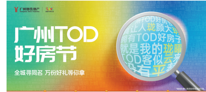
广州地铁地产推出“五一”黄金周多重好礼活动

随着新一代信息技术、绿色低碳技术、新产品、新材料、新工艺不断运用到房屋建设中,“好房子”为房地产行业带来了广阔的发展前景。住建部强调,要“以努力让人民群众住上更好的房子为目标,从好房子到好小区,从好小区到好社区,从好社区到好城区,进而把城市规划好、建设好、治理好”。今年全国两会期间,“好房子”更是首次被写入政府工作报告,明确要“适应人民群众高品质居住需要,完善标准规范,推动建设安全、舒适、绿色、智慧的好房子”。