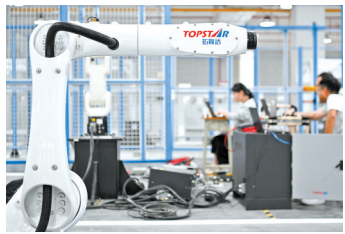
广东省已成为全国领先的智能机器人产业集聚区

惠州亿纬锂能股份有限公司(简称“亿纬锂能”)是一家集全球竞争力的锂电池平台型企业,其生产的锂亚硫酰氯电