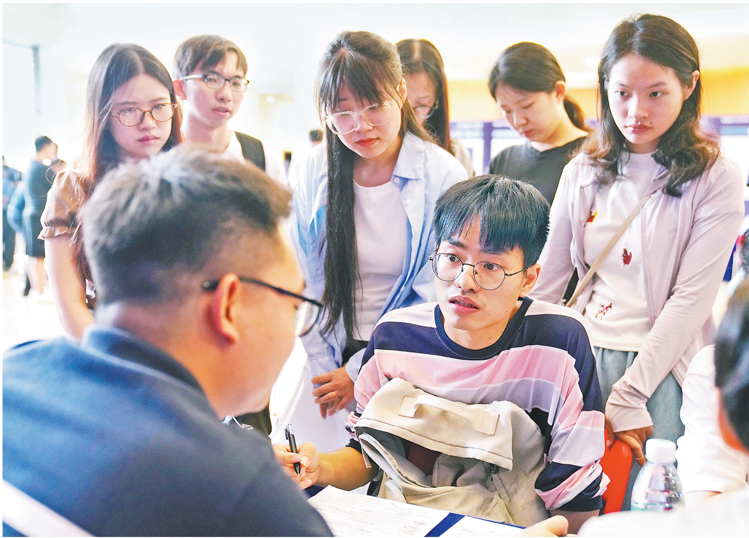
5月10日，“百万英才汇南粤”制造业专场招聘活动（省内专场）在华南理工大学（五山校区）举行