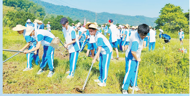
天河职业高级中学综合高中班的学生在学农