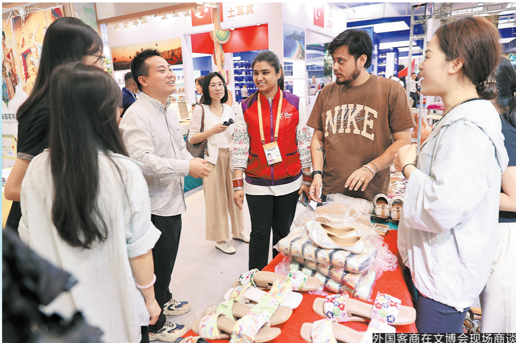
外国客商在文博会现场商谈

24日，第二十一届中国(深圳)国际文化产业博览交易会(以下简称“文博会”)现场展馆内人潮如织。这里不再是单纯的文化展示空间，而是一个累计成交额达3万亿元的超级市场。参展商用不同语言快速敲定订单，买家手持平板实时比对数据……文博会用最直观的方式证明，文化交流与文化贸易可以“两条腿”走路，流量终将化作真金白银的增量。