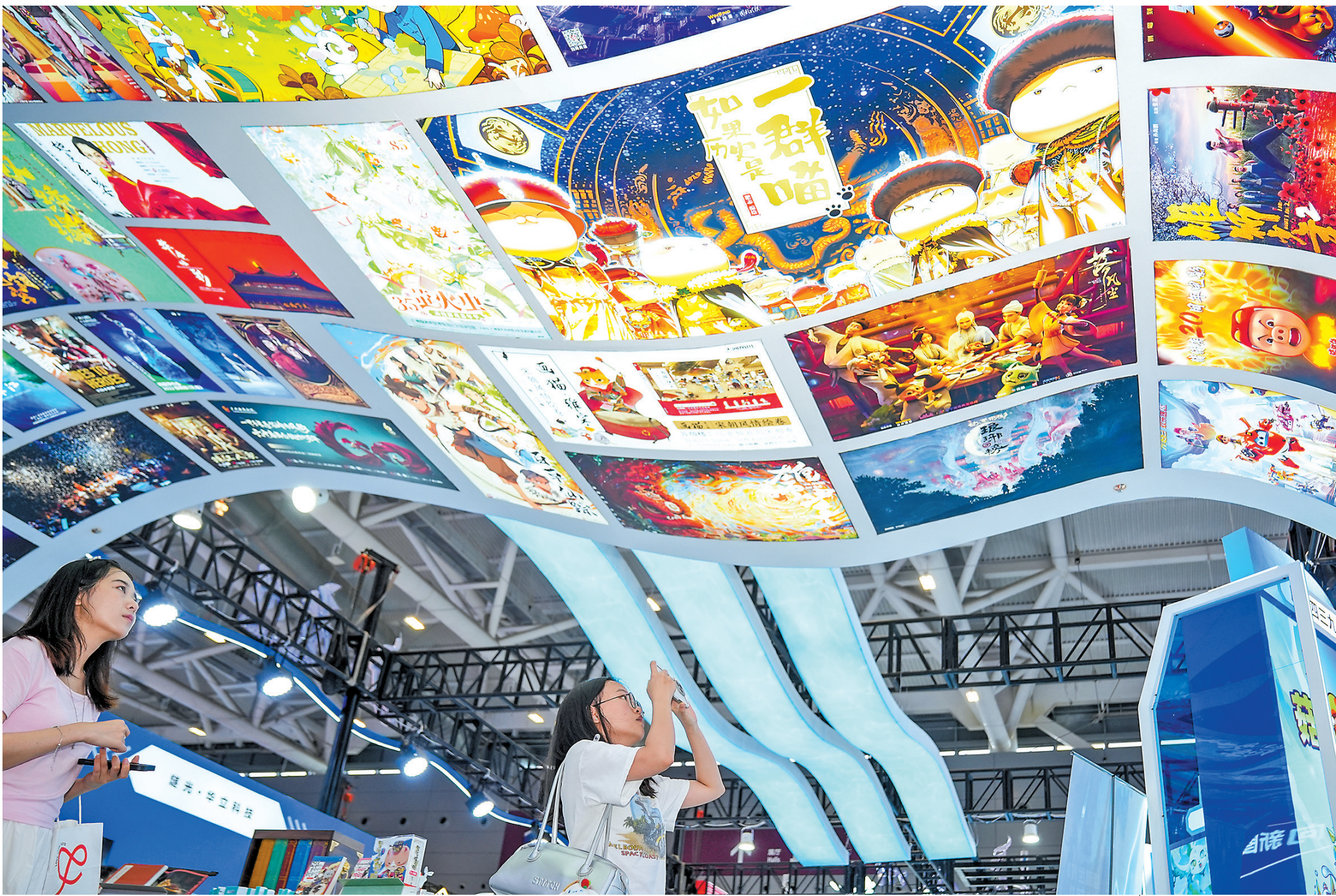
▲文博会上展示了众多广州的优秀动漫及影视作品

作为“文化金桥”，本届文博会的国际朋友圈再度扩容。共建“一带一路”国家参展数量创历史之最，从埃及文物大展到深圳口岸涌入的外籍客商，从中国华服出海大会到“奶龙”联名徽章的全球热捧，文化在这里既是“软实力”，更是“硬通货”。而深圳本土力量亦不甘示弱：前海分会场以“文商旅融合+科技赋能”探索新质生产力，南湾康利城则以“IP出海”串联起文化价值链。这场双向奔赴的文明对话，既让世界听见中国故事，也为构建人类命运共同体注入文化动能。