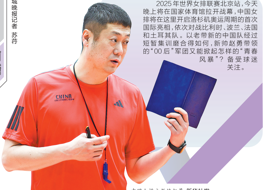
中国女排主教练赵勇