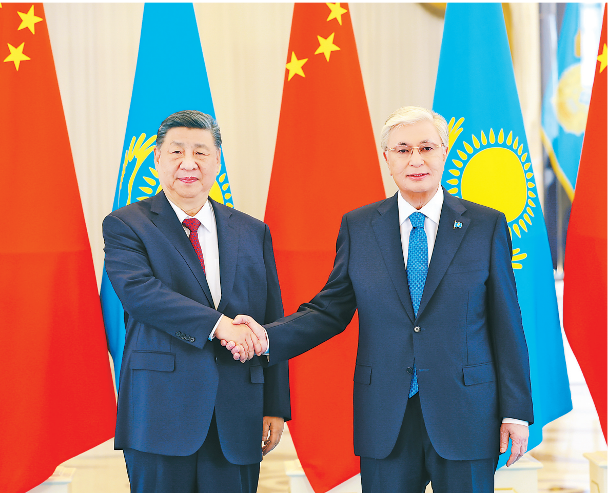
当地时间6月16日下午，哈萨克斯坦总统托卡耶夫同中国国家主席习近平在阿斯塔纳总统府举行会谈。