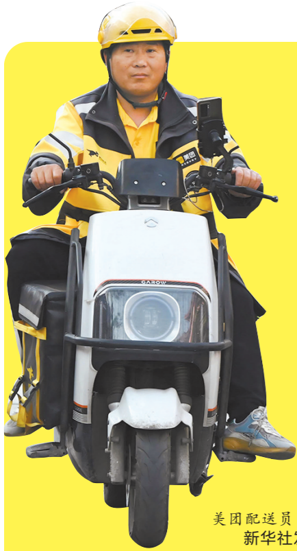
美团配送员