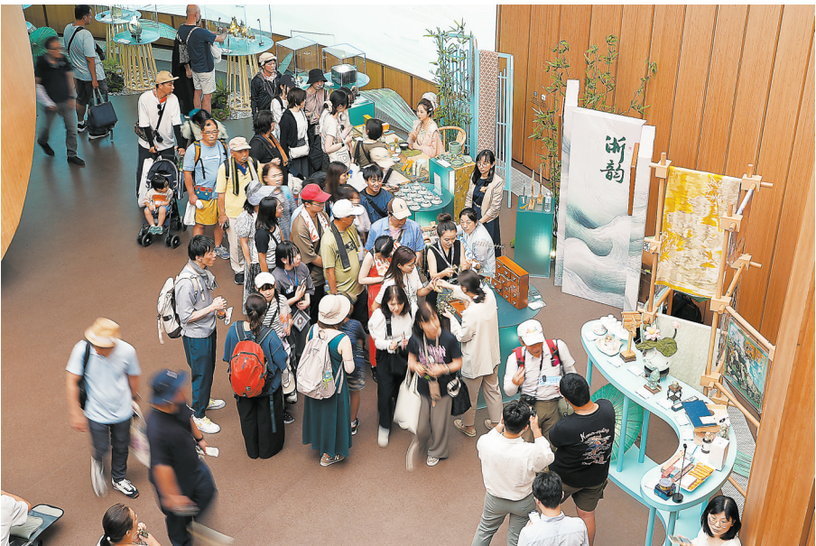
7月12日拍摄的日本大阪世博会中国馆“浙江周”活动现场