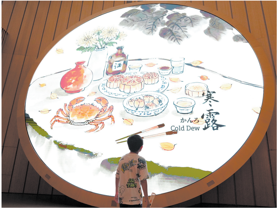
7月11日，游客在日本大阪世博会中国国家馆内参观