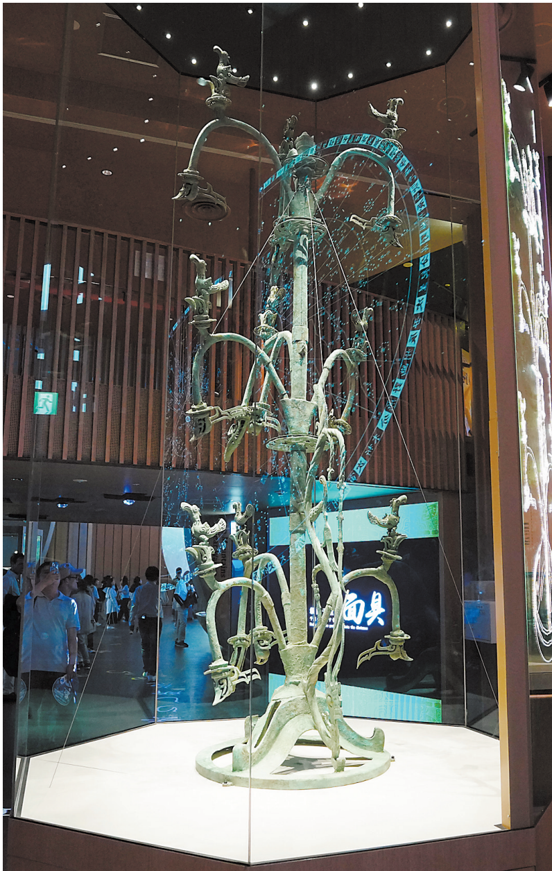
7月11日，游客在日本大阪世博会中国国家馆内参观