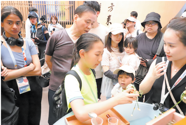
7月12日，一名女孩在日本大阪世博会中国馆“浙江周”活动上体验中药香囊制作