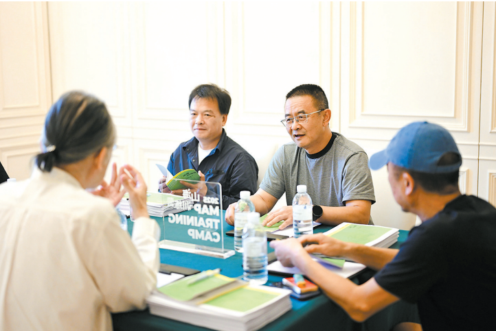
评委们在山海计划公开提案大会后进行讨论