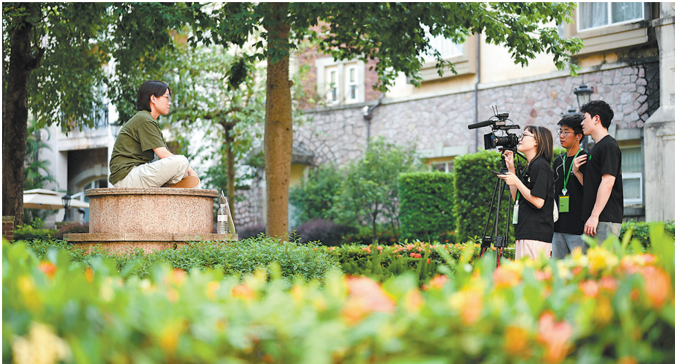
青年导演接受主办方采访