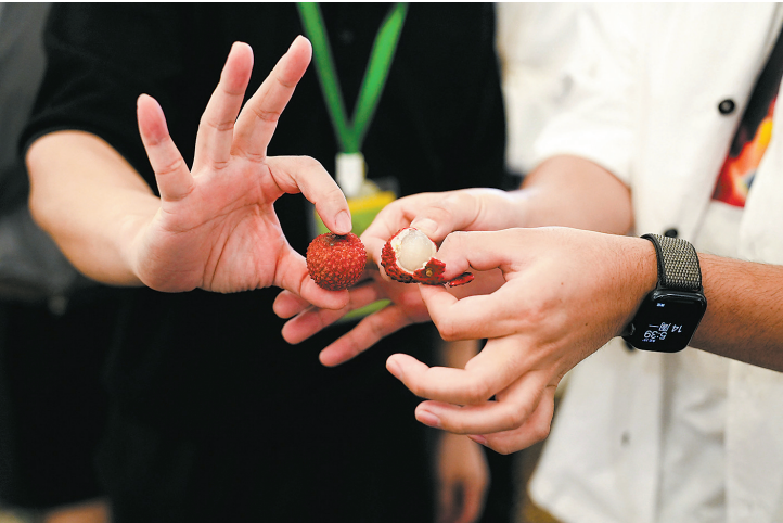
山海计划训练营现场，青年导演们品尝广东荔枝