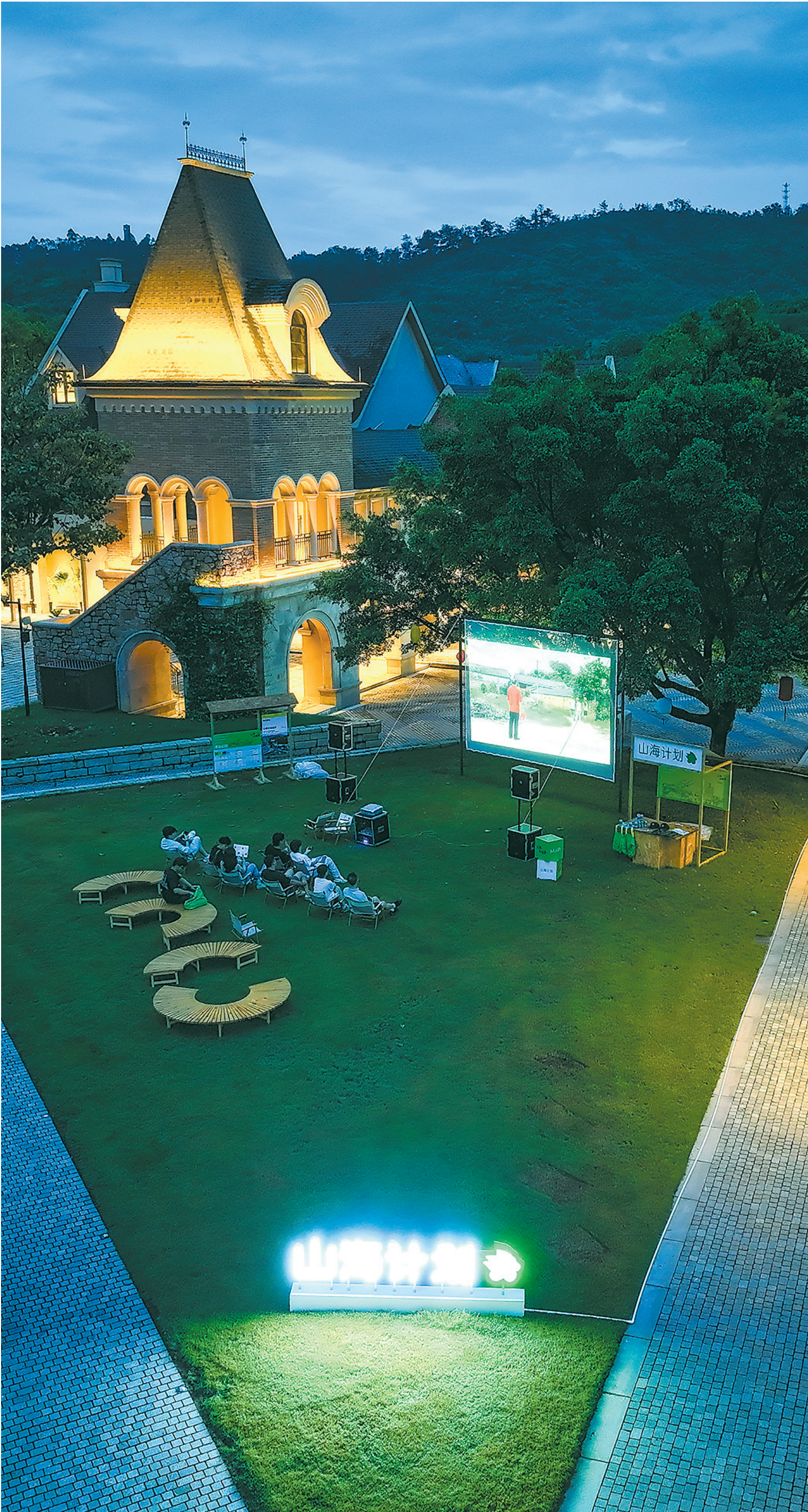
山海训练营户外放映环节，年轻导演们在草地上观看山海计划历年短片