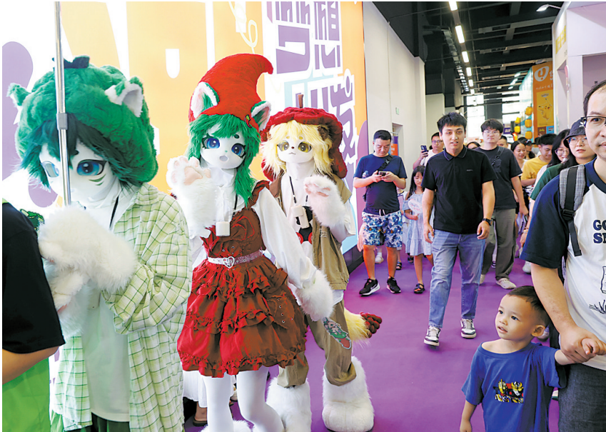
漫博会Cosplay巡游

莞设立总部、区域中心、研发基地，最高资助500万元。东莞市镇还将联手提供优质低成本产业空间，支持园区争创各级文化产业示范园区，最高奖励200万元。东莞还将适时设立潮玩动漫产业专项子基金，串联投资上下游产业，引导信贷资源精准滴灌潮玩企业，同时进一步加强人才培养和引进，强化行业服务，为潮玩动漫产业发展营造更优发展环境。