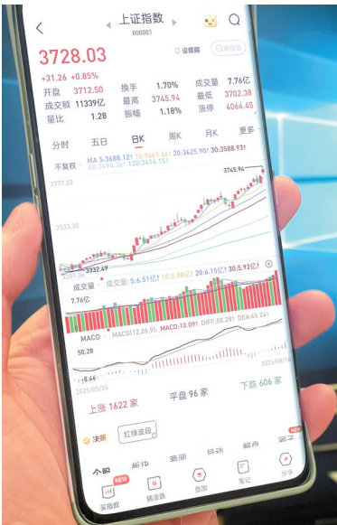
18日截至收盘，沪指报3728.03点

中欧瑞博对记者表示：“我们认为目前已经处于牛市的第二阶段，也就是在犹豫中发展的阶段。再往后看，随着赚钱效应的加强，股市对市场外资金的吸引力会继续上升，届时牛市会进入第三阶段，也就是在乐观中成熟的阶段。从过去经验看，牛市中只要景气度不差、估值不算贵的板块都会轮动到，但由于各细分板块的景气度和估值差异较大，所以各板块的上涨节奏可能会有差异。创新药、AI、金融都是我们看好的牛市高弹性板块，高股息通常在牛市中弹性会小一些。”