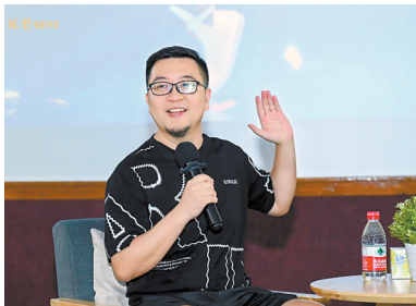
电影《落凡尘》导演钟鼎