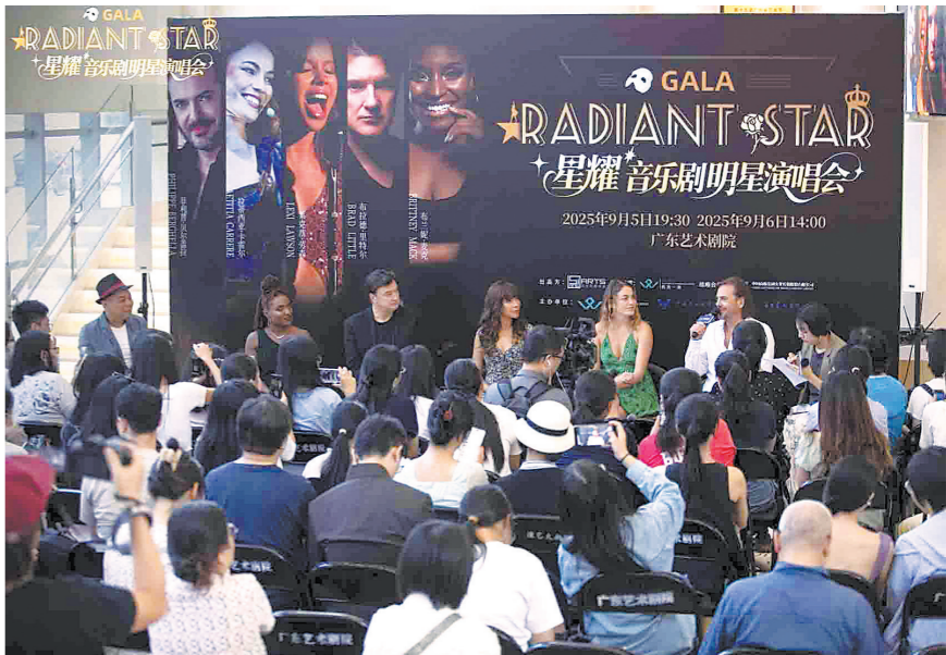
主演见面会现场

整场演出不仅囊括了《悲惨世界》《剧院魅影》《吉屋出租》等英语经典，也融入了《唐璜》《巴黎圣母院》等法语名作，更不乏《汉密尔顿》《六皇后》等当代热门剧目金曲。演出以音乐剧语言串联起跨越时空的情感共鸣，让观众在经典与现代的交织中，感受音乐剧的魅力。