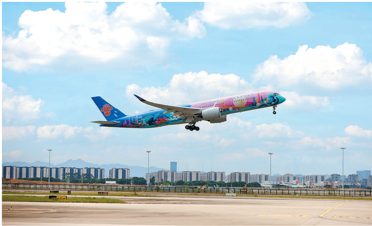
9月19日14时，南航首架十五运会主题彩绘飞机“活力湾区号”从广州白云国际机场起飞

“广州还将开拓珠江游低空经济应用场景。”徐红雨介绍，广州将推进琶洲港澳码头、太古仓码头、大沙头游船码头等一批码头建设低空地面配套基础设施，推进海心沙多功能起降场建设，积极推进策划“珠江夜游低空之旅”等项目实施。预计3年内将开通海心沙环线、阅江环线、花城广场线、新中轴线等低空观光旅游航线。远期将推进至东圃特大桥，贯穿珠江新城，连通东、西空中交通航线，实现低空观光、商务出行、应急救援、物流配送、空中巡检等多种应用场景。此外，珠江游将开通全运会专属航线，打造15艘十五运会主题游船；加快推进新能源新技术赋能，力争到2028年珠江夜游船100%纯电动化。