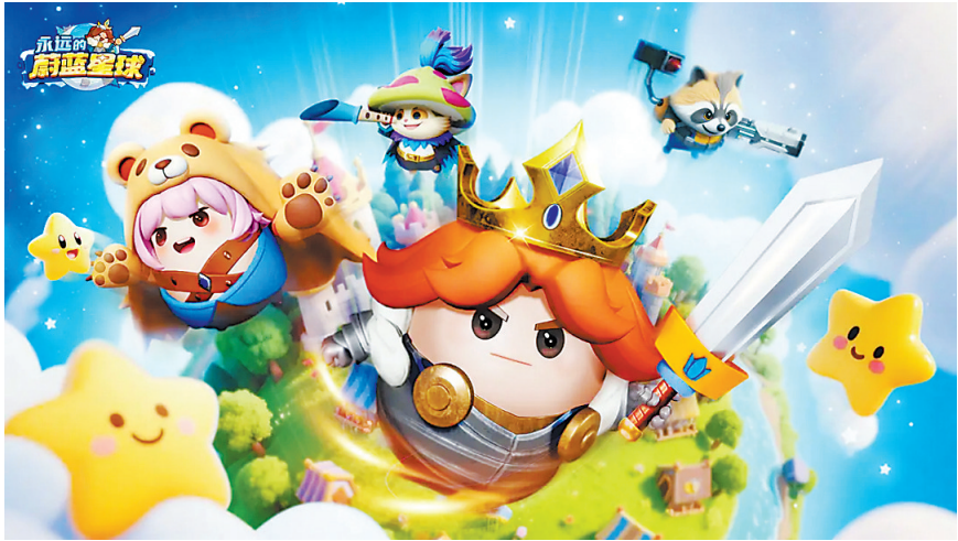
诗悦网络推出的《永远的蔚蓝星球》

在广州的游戏市场,一个新的产业风口正在让广大玩家疯狂“上头”。“别笑,你试你也过不了第二关”“屋顶漏了,快来帮帮我们吧”……从折螺丝到倒水瓶,这类洗脑式小游戏频频在社交媒体刷屏,成为玩家消磨碎片时间的新宠,其中有不少小游戏产品出自广州的游戏厂商。 羊城晚报记者统计发现,在DataEye最新发布的2025年8月《微信小游戏畅销榜百强榜》中,由广州游戏厂商发行的产品共有22款,数量位居全国第一,高于深圳、北京等城市。这意