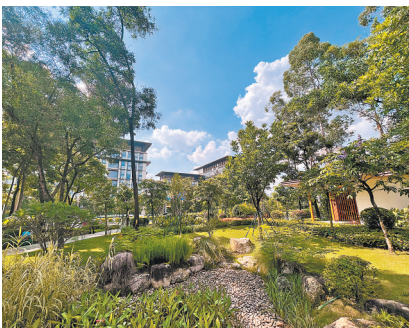
白云新城云憩里公园引入自然美景

截至2024年年底，广州全市建成口袋公园428个，弥补了中心城区大型绿地分布不均的不足，为市民营造了“家门口”的高品质绿色休憩空间。为了更好满足人民群众对美好生活的期待，近期，广州市政协城建资源环境委围绕“建设口袋公园，打造优美绿色空间”的主题，组织政协委员、专家学者广泛开展调研，与职能部门共谋“口袋公园建设管养”的发展良策。