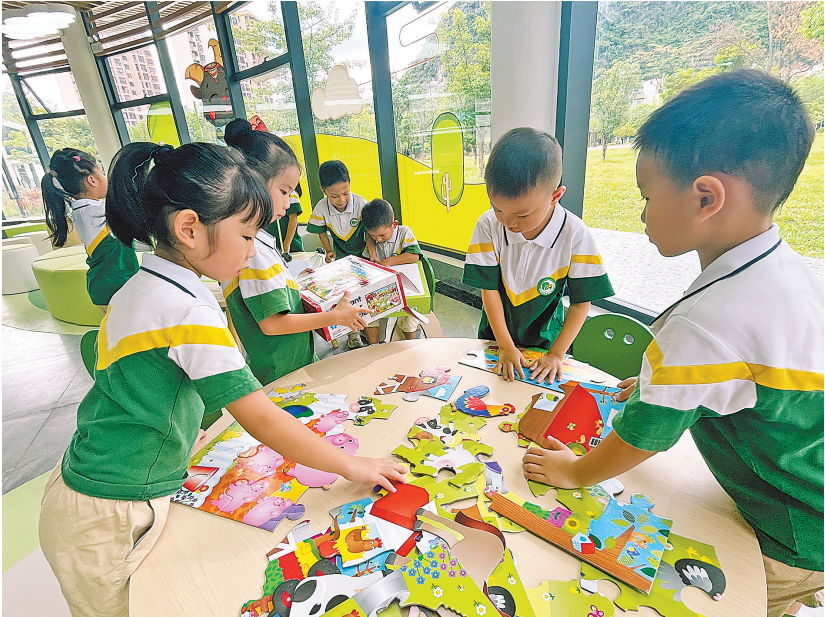
孩子们在党群服务中心玩耍

材料和圆角设计，设置分龄活动区、儿童会客中心及多功能集装箱驿站，融入壮族会鼓、三声部民歌等非遗元素，并通过AR技术开展沉浸式科普教育，切实提升山区儿童公共服务品质。在中心建设过程中，福田—马山儿童友好党群服务中心获得了园岭街道多方面支持。园岭街道不仅积极提供经验，还发动辖区单位及深圳市东西方社工服务社、深圳银泰证券公司等社会力量参与其中，筹集到总价值27.6万元的图书、益智玩具、艺术教具、体育器材等物资，为山区儿童送去来自深圳的温暖关怀，也为两地深化协作注入人文温度。