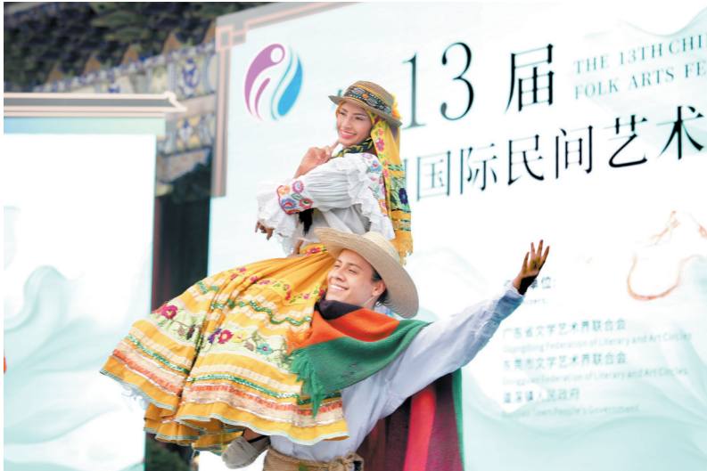
演出现场

羊城晚报讯 记者石梦卓报道：10月20日至21日，第13届中国国际民间艺术节巡演走进“国际制造名城”东莞，在有“中国曲艺之乡”美誉的道滘镇精彩上演。来自荷兰、哥伦比亚、塞尔维亚、毛里求斯等国家的艺术团体，与东莞本地文艺工作者联袂登台，为市民呈现一场跨越山海、融汇东西的文化盛宴。