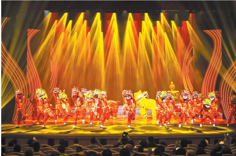
深圳黄连胜醒狮团携手十围小学少儿醒狮团同台献艺

羊城晚报讯 记者党学为报道：10月20日晚，第13届中国国际民间艺术节深圳专场演出在深圳宝安西乡会堂璀璨启幕。