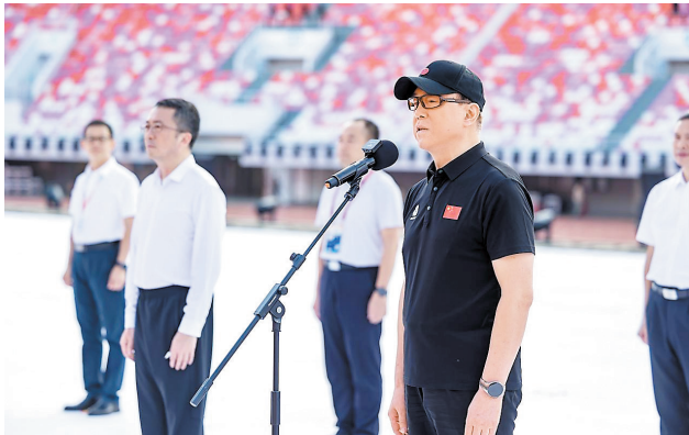
十五运会和残特奥会开幕式总导演郎昆发言