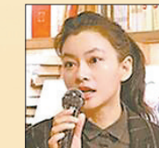
张柠 北京师范大学文学院教授