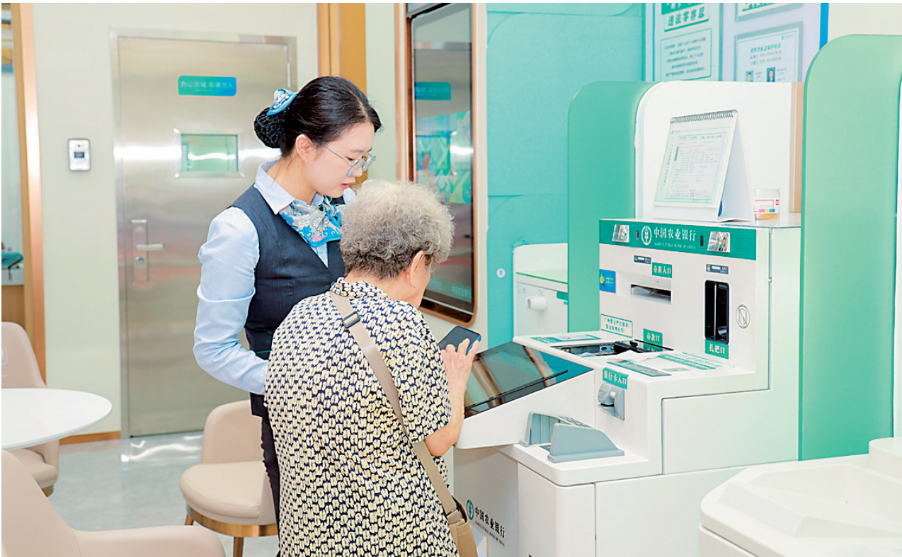
中国农业银行暖心服务为百姓

“十四五”以来,粤港澳大湾区建设热潮奔涌,南粤大地高质量发展征程蹄步稳。作为服务地方经济社会发展的金融主力军,中国农业银行广东省分行(下称“农行广东分行”)始终锚定“金融为民”的初心使命,以普惠金融为重要抓手,主动融入广东发展大局:从破解小微企业“首贷难”的痛点堵点,到搭建智慧金融服务网的便捷通道,从激活个人消费市场的惠民实践,到筑牢消费者权益保护的安全防线,全方位、多维度打通金融服务民生“最后一公里”,为南粤大地经济提质增效、民生福祉升级注入源源不断的金融动能。