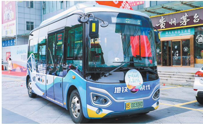
贴着主题车贴的车辆

以公交为例,东莞将开通5条免费公交接驳专线。目前,首批3条线路已投入试运营,实现与地铁站、赛区的无缝衔接,全部5条专线将于11月1日起正式运营。据了解,5条接驳专线全面覆盖东莞市体育中心体育馆、东莞篮球中心、石龙体育中心等主要比赛场馆。具体线路包括:市民服务中心至东莞体育中心体育馆线、东莞市体育中心单边循环线、国贸中心站至东莞篮球中心线、东莞篮球中心单边循环线,以及东莞火车站快速接驳区至石龙体育中心线。