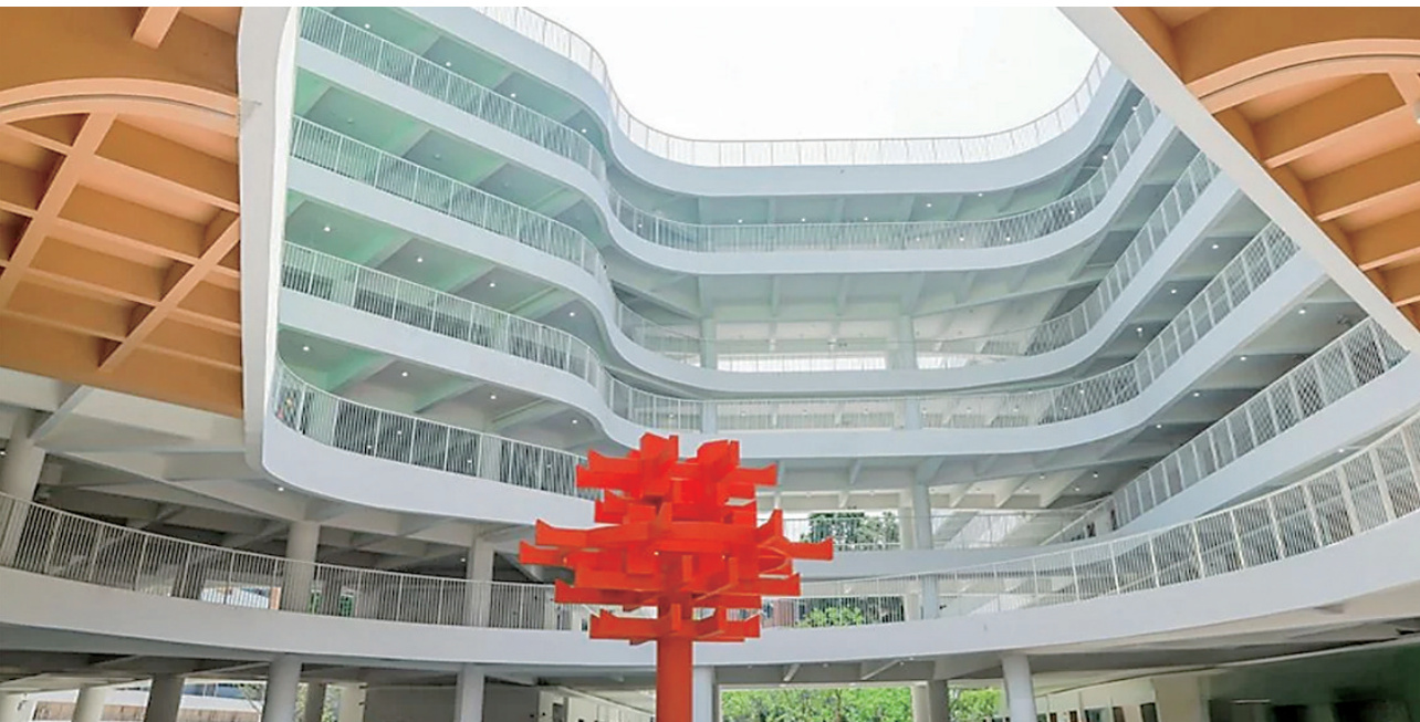
华中师范大学东莞东城学校内景