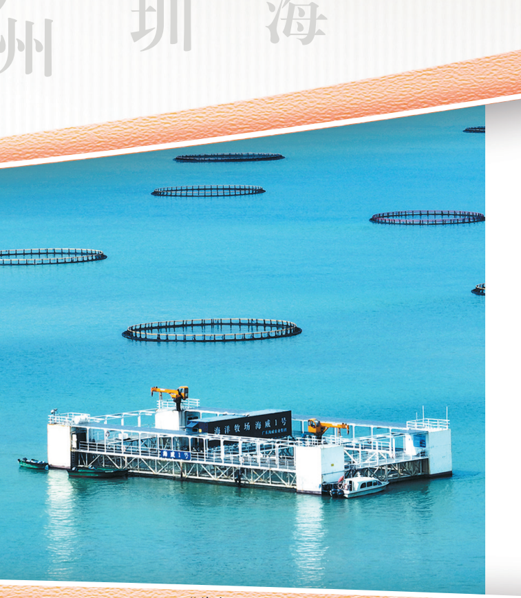
“蓝色粮仓”海成1号(资料图)