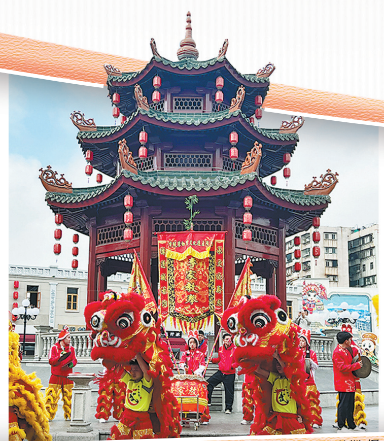
在汕头小公园开埠区举办的民俗活动(资料图)