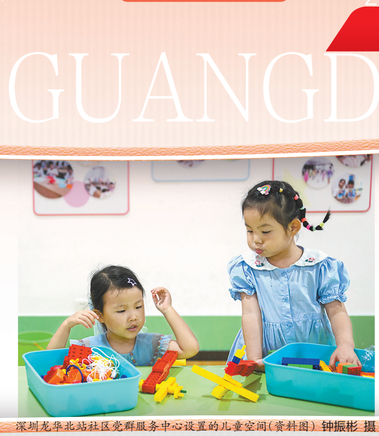
深圳龙华北站社区党群服务中心设置的儿童空间(资料图)