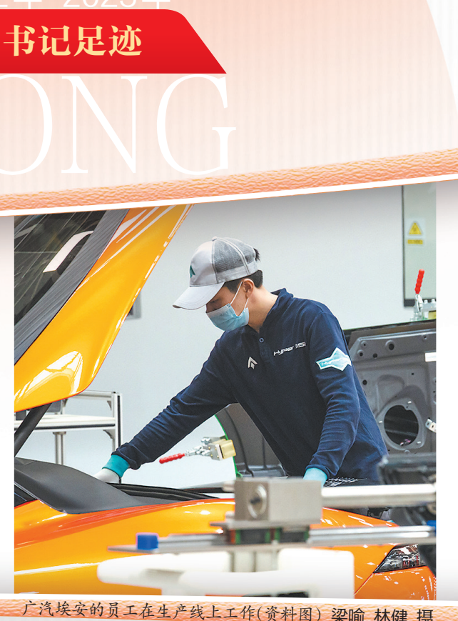
广汽埃安的员工在生产线上工作(资料图)