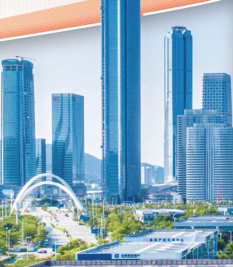
珠海风光(资料图)