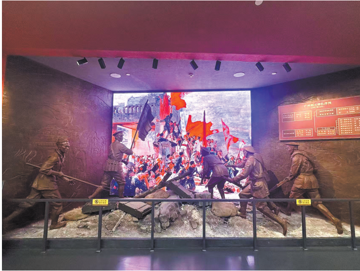
雕刻和光影技术还原历史场景

据了解,叶剑英纪念园由叶剑英纪念馆和叶剑英故居组成。今年1月,叶剑英纪念馆完成改陈布展,以全新的面貌恢复对外开放。其中,展厅应用了多媒体、雕塑场景、全息影像、电子触摸、智慧语音讲解、AI高清修复等新技术,让参观者能够全身心沉浸在红色文化场景中,更好地传承红色基因、赓续红色血脉。