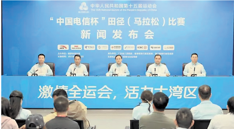
新闻发布会现场