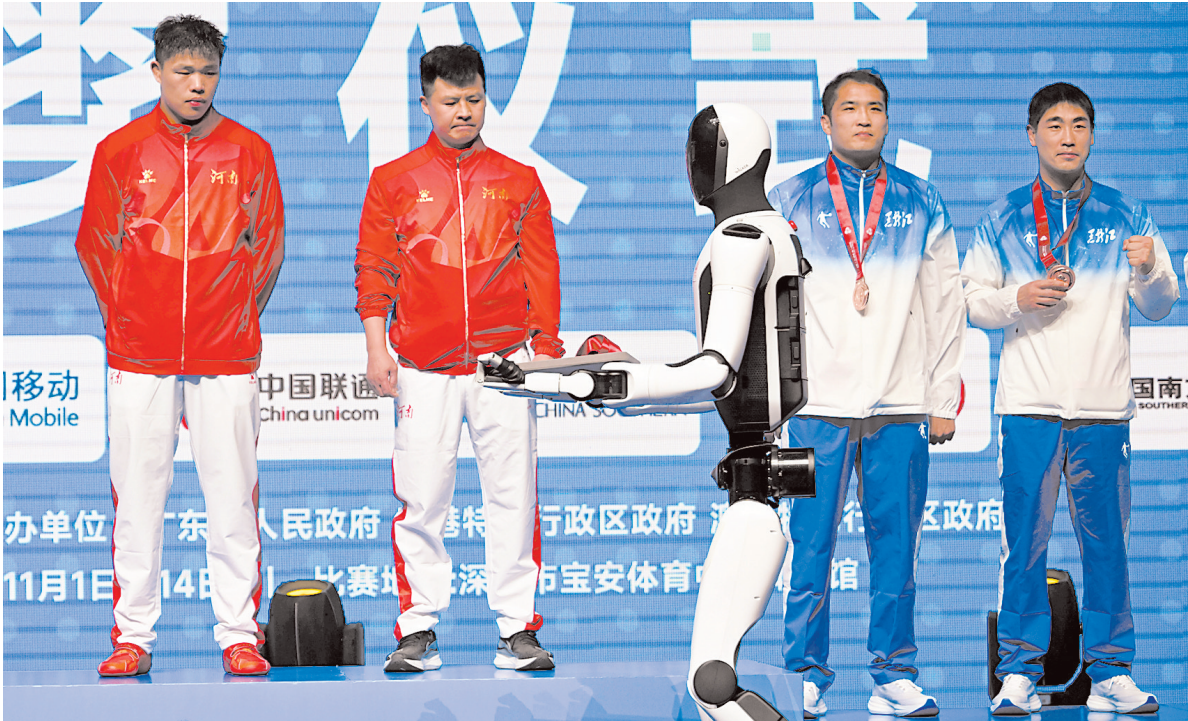
14日,人形机器人手捧奖牌亮相拳击男子92公斤级颁奖仪式,高科技产品介入赛场成为常态

随着四年一度的中国体育盛事在大湾区上演,临近岁末的广东经济也在悄然迸发活力。这场由粤港澳三地联合举办的体育赛事,带着浓浓的“新”意而来。那就是科技、消费、商业、产业的新场景已经全面铺开,并将持续影响到运动会之后很长的时间。十五运会远不只是一场体育竞技的盛宴,它正成为一个巨大的“场景创新引擎”,通过创造真实、高强度的需求环境,倒逼技术突破、验证商业模式、加速产业融合。