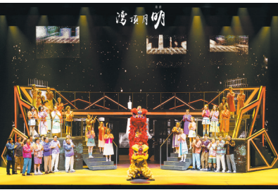
《湾顶月明》展现粤港澳大湾区建设勃勃生机

欸服务提质,打造“没有围墙的文化馆”。2026年,文化馆将深化数字化转型,构建“订单式”“点单式”智慧