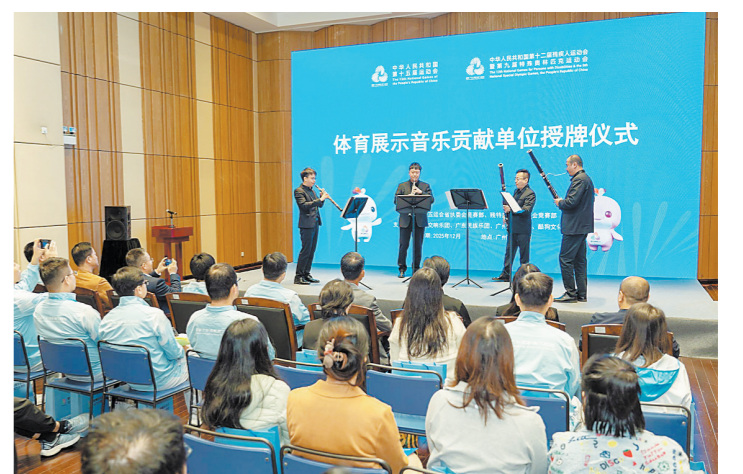
音乐家们现场演奏音乐库作品