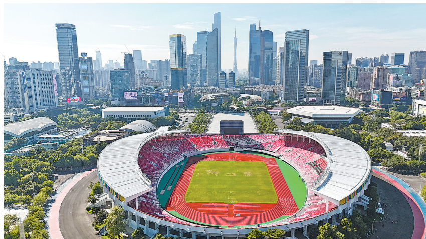
天河体育中心是广州最大的综合性体育场地之一。每年,有大量体育赛事、文艺演出落户天河体育中心

12月18日,中国数字文娱大会在羊城创意产业园启幕。在大会上,广州市天河区正式发布2026年度系列音乐演艺活动计划。据悉,从今年12月26日到2026年1月,歌星邓紫棋将再次回到广州和天河连开10场演唱会。2026年天河区将引进大型演唱会达53场,包括周杰伦、薛之谦、李荣浩、蔡依林、王力宏、孙燕姿、谢霆锋、时代少年团等在内的顶流大咖都将在广州天河区开唱。