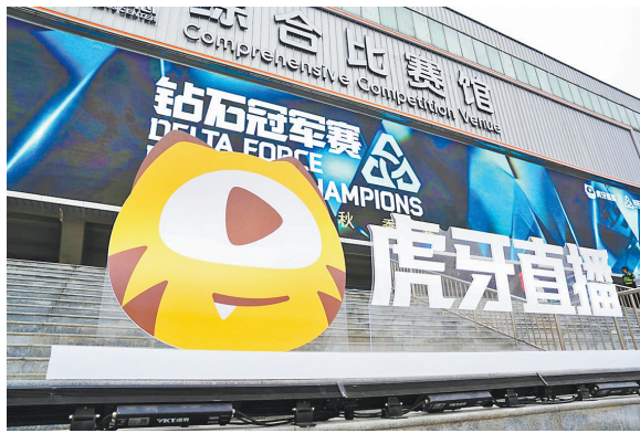
DDC 钻石冠军赛秋季赛决赛落地成都

本届赛事以“淬火成金”为主题,不仅实现战队规模与竞技质量的双重突破,更以标准化、专业化的赛制设置,成为三角洲行动职业化体系构建的关键助推器。参赛战队从夏季赛24支增至36支,增幅达50%,不仅涵盖卫冕冠军、传统豪门,更通过公开海选吸纳众多实力新锐,形成“顶尖梯队引领+新锐力量突围”的良性竞争格局,为三角洲