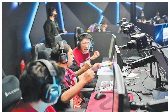
DDC 钻石冠军赛秋季赛决赛现场