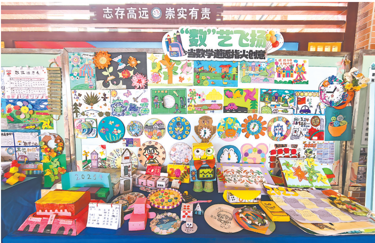
美育学科融合“数”艺飞扬工作坊展示

面向未来,广东省教育厅将持续深化美育改革,进一步发挥岭南文化独特优势,完善“政府—高校—中小学—社会”多方协同机制,不断补齐区域美育短板,让美育之花在南粤大地处处绽放,为教育高质量发展注入更多“美”的动力。