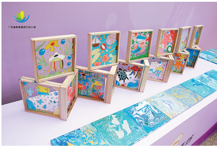
美术作品工作坊的“相框”充满童真

广东美育始终深耕岭南文脉,在美育行动的浸润下,各地还纷纷将非遗搬进课堂,实现非遗传承与现代美