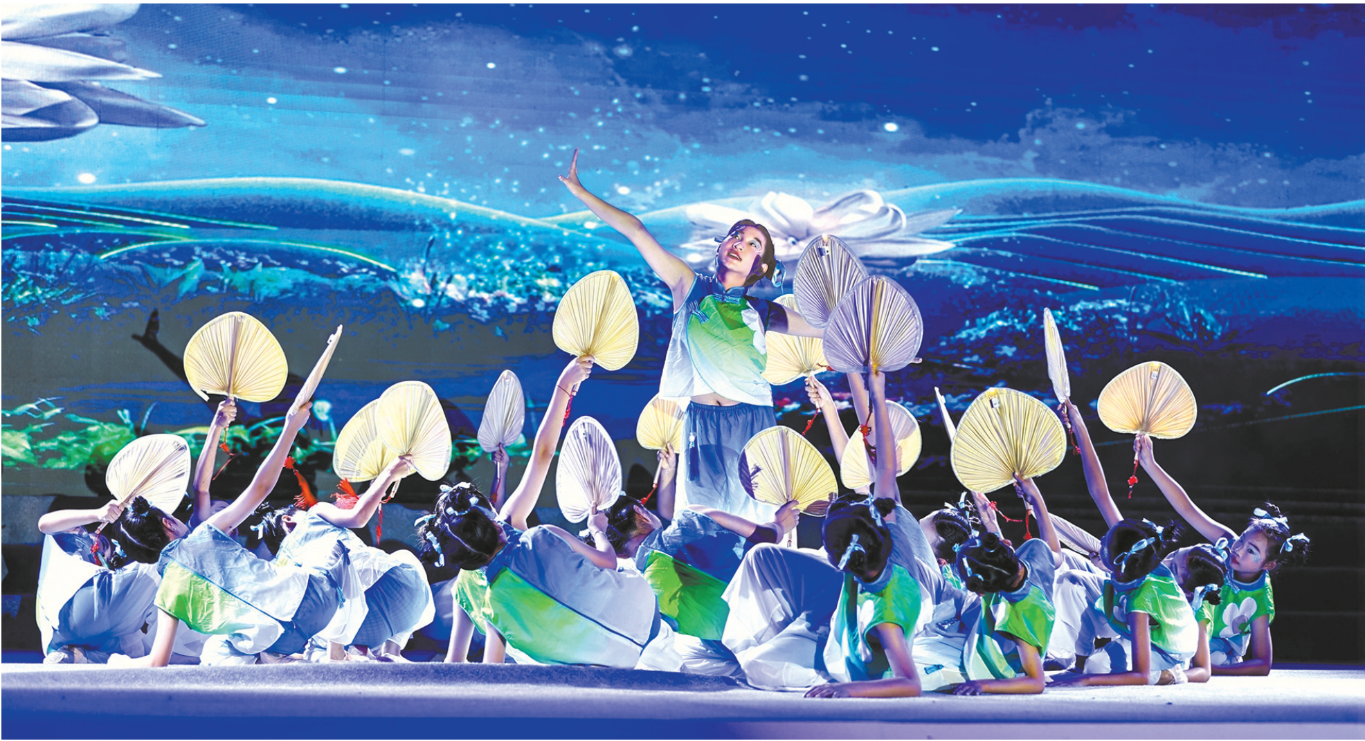
在舞台上,每个孩子都是闪闪发光的主角

如今,岭南大地涌动着以美育人、以美化人的蓬勃生机,形成了地方特色鲜明、高校引领赋能、社会协同发力的区域整体性大美育新范式。