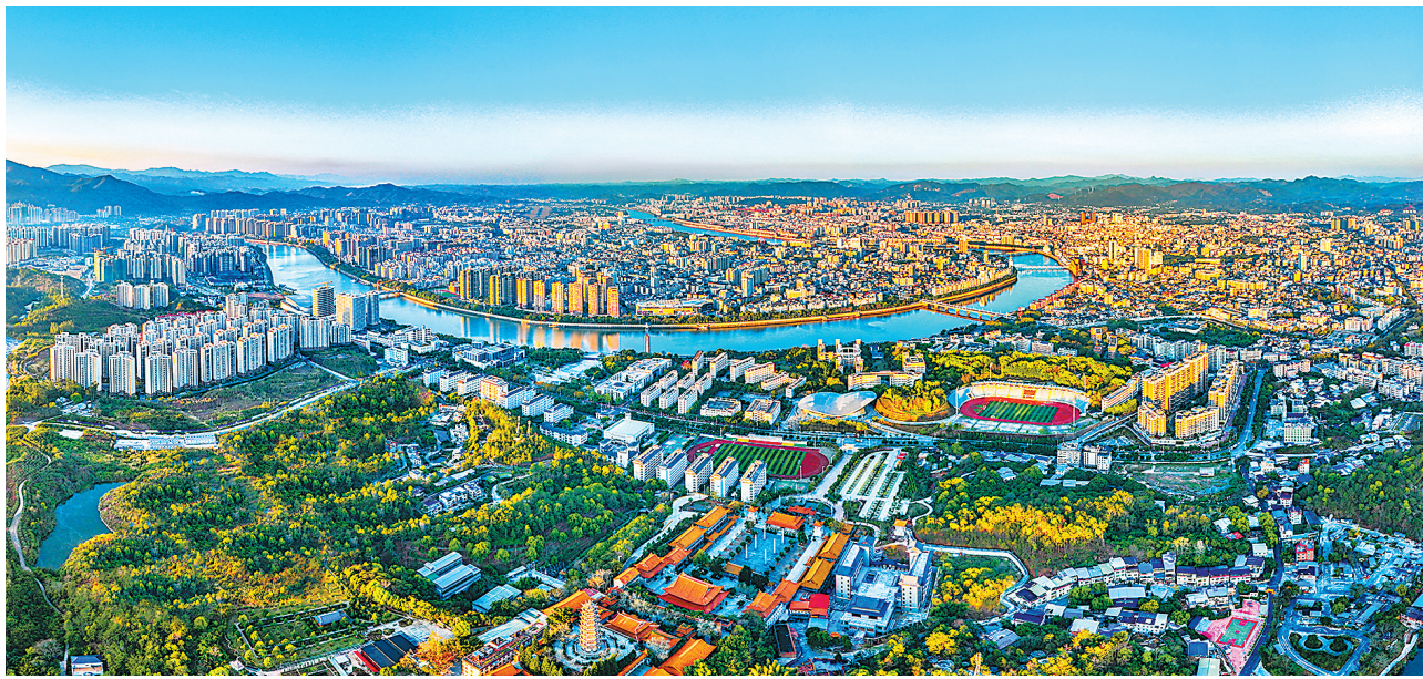
广东“百千万工程”成果丰硕,作为“粤东北末梢”的梅州正迈向“区域协同前沿”(资料图片)

关+成果转化+科技金融+人才支撑”的全过程创新链,鹏城实验室、广州实验室引领高水平实验室体系,在粤国家重大科技基础设施达10个,基础研究十年“卓粤”计划深入推进,为新旧产业迭代注入动力。