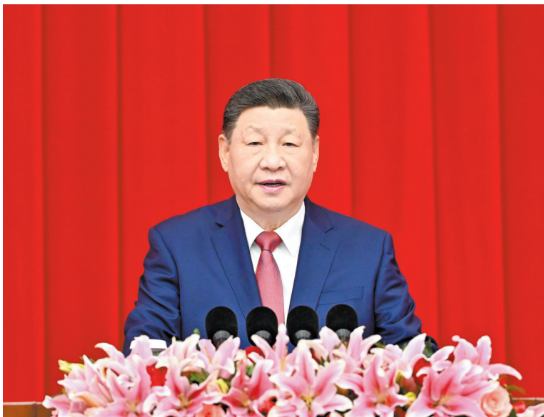
2025年12月31日，全国政协在北京举行新年茶话会。中共中央总书记、国家主席、中央军委主席习近平在茶话会上发表重要讲话