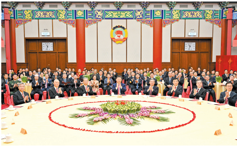
2025年12月31日，全国政协在北京举行新年茶话会。党和国家领导人习近平、李强、赵乐际、王沪宁、蔡奇、丁薛祥、李希、韩正出席茶话会并观看演出

新华社电 中国人民政治协商会议全国委员会2025年12月31日上午在全国政协礼堂举行新年茶话会。党和国家领导人习近平、李强、赵乐际、王沪宁、蔡奇、丁薛祥、李希、韩正等同各民主党派中央、全国工商联负责人和无党派人士代表、中央和国家机关有关方面负责人以及首都各族各界人士代表欢聚一堂，共迎2026年元旦。