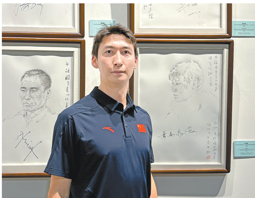
武大靖和他的素描画像(资料图)

平昌冬奥会，在将近20天的时间里，中国代表团多次遭遇争议判罚，直到最后一天前一金未得。唯一夺金希望，系于最后一天武大靖的500米赛道。至暗时刻，巨大的压力并没有压垮这位东北汉子。因对手冰刀断裂意外中断重赛，在消耗了大量体力的情况下，站在冰上的武大靖依然“笔直站立”，绝不让对手看出疲惫。