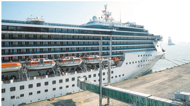
2026年首条在广州南沙母港起止的“东南亚三国”邮轮航班正准备启航

略,南沙的定位被清晰纳入“广州-深圳-香港”三港联动体系。这标志着,“家门口登船”的便利性,正升级至大湾区邮轮产业协同整合、生态共建的新阶段。在此战略下,南沙的硬件优势与产业积累将发挥核心作用——其1600米规划岸线、大型泊位以及年设计通过能力75万人次的规模,为承接增量运力、保障三港联动运营提供了坚实基础。随着口岸持续优化、航线产品体系不断完善,南沙母港正为粤港澳大湾区文旅融合与广州国际消费中心城市注入新动能,持续擦亮十年打磨的“黄金名片”。