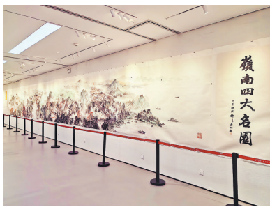
《岭南四大名园》展览现场

2026年1月5日,“中国当代书画名家精品展”在岭南艺术馆开幕。展览汇聚了全国五十六位书画名家的120余幅艺术精品,全国各地艺术家的精品力作齐聚一堂。其中广东人文山水长卷作品《岭南四大名园》,将余荫山房、清晖园、梁园、可园的独特风韵尽显其中。